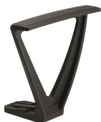
Réf. 1390 Paire d'accoudoirs fixes