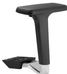
Réf. 1680 Paire d'accoudoirs réglables 4D