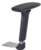
Réf. 1679 Paire d'accoudoirs réglables 3D