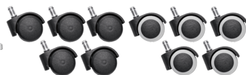
Réf. 10207 Jeu de 5 roulettes sol moquette