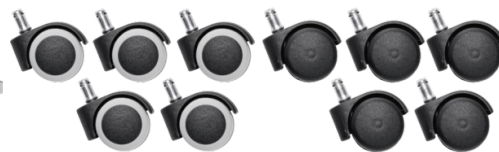
Réf. 10208 Jeu de 5 roulettes sol dur