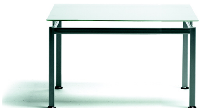
TABLE D'ACCUEIL CARREE