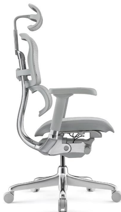
SIEGE ERGONOMIQUE SYNCHRONE 24h/24h