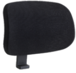
Têteière Pullman Réf. 7557