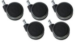
Jeu de 5 roulettes grand diamètre Réf. 10206